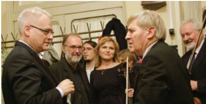
Predsjednik Ivo Josipović čestita slavljeniku