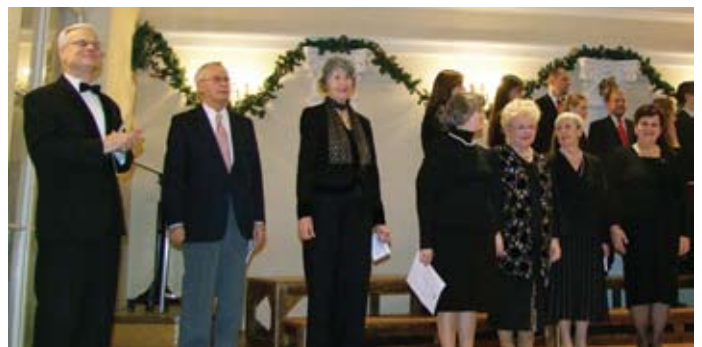
Članovi Društvenog komornog ansambla