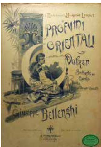
Giuseppe Bellenghi: Profumi orientali, valzer brillante, Firenca, 1888.