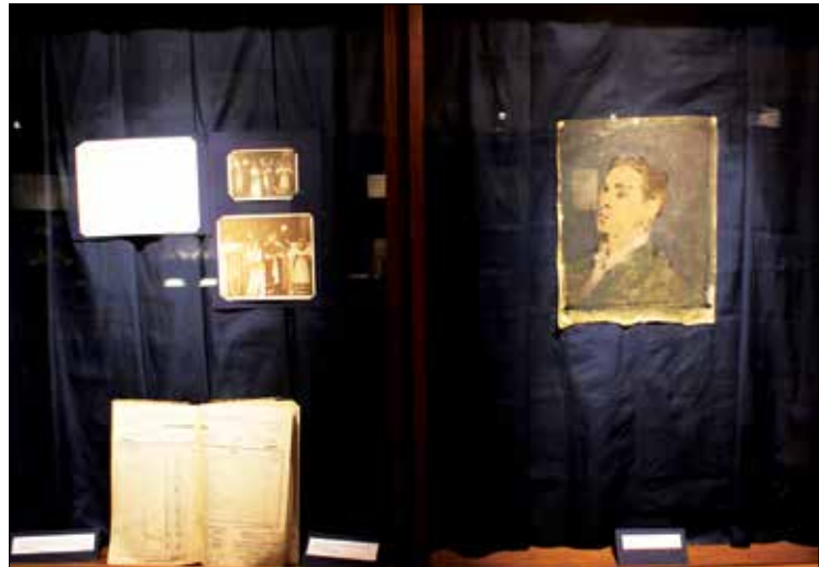
Fotografija Obračunske knjige HGZ-a koja će biti izložena u Hrvatskom povijesnom muzeju i podsjetnik na vitrinu u kojoj je bila izložena na HGZ-ovoj izložbi Družina mladih - “san na javi” krajem prošle godine.