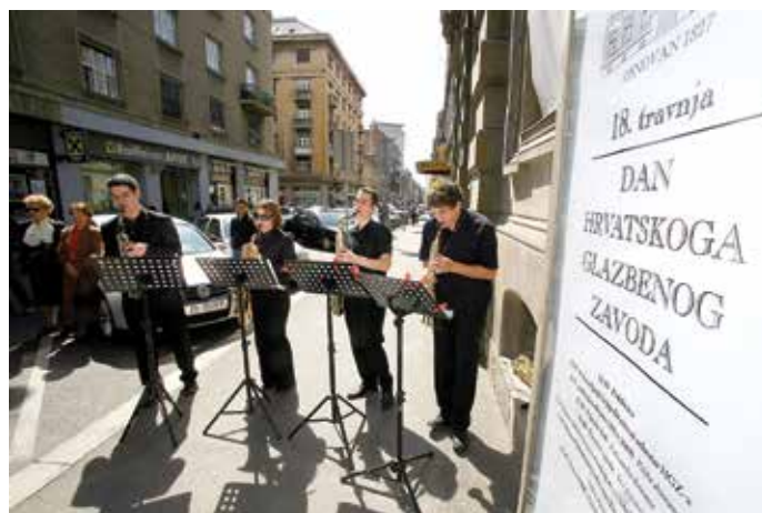
Uspomena na prvi Dan HGZ-a, 18. travnja 2009. godine: studenti Muzičke akademije sviraju podoknicu.

Prvi Dan HGZ-a 2009. godine bio je zamišljen kao dan otvorenih vrata, s besplatnim programima za članove HGZ-a i širu javnost, u spomen na 18. travnja 1827., kada je HGZ započeo sa svojim radom. Poštujući te smjernice tijekom proteklih devet Dana HGZ-a uvijek smo publici ponudili obilazak zgrade i koncert; uz to je bilo i okruglih stolova, predstavljanja HGZ-ovih izdanja; gostovali su mladi glazbenici i renomirani ansambl, a ponekad se moglo i zaplesati. Želja nam je i ove godine pokazati našu djelatnost i ugostiti naše članove i sve ljubitelje glazbe.